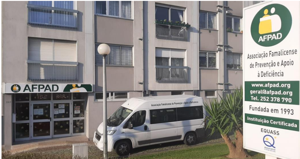
Sede – Vila Nova de Famalicão

A AFPAD encontra-se sedeadada no R/C do edifício Tripeira. A fração autónoma designada pela letra “A”, correspondente ao R/C e é propriedade da Associação Famalicense de Prevenção e Apoio à Deficiência.