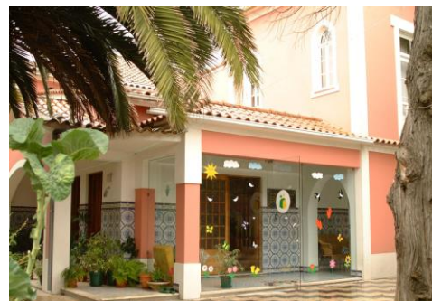
Lar Residencial “A Minha Casa” - Vermoim